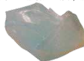
Liant silicate de potassium