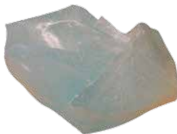
Liant silicate de potassium