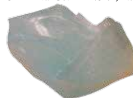
Liant silicate de potassium