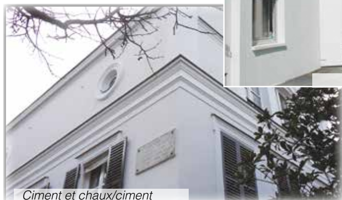
Ciment et chaux/ciment