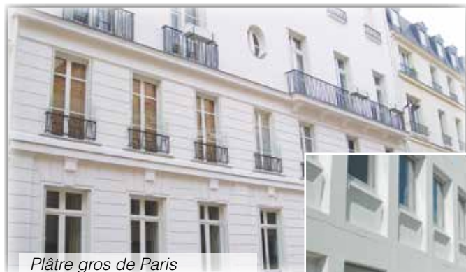
Plâtre gros de Paris

Adapter aux nombreux matériaux des façades :