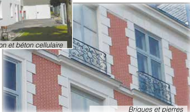
Briques et pierres

La Cristalisse est accompagnée dans notre gamme de plusieurs autres produits de préparation et de sous-couches qui s'adaptent aux pathologies et aux désordres rencontrés lors des rénovations.