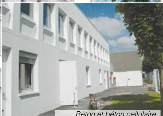
Béton et béton cellulaire